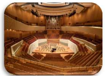
ミューザ川崎 シンフォニーホール

主催：幸区役所 後援：「音楽のまち・かわさき」推進協議会 企画・運営：さいわいハナミズキコンサート運営委員会