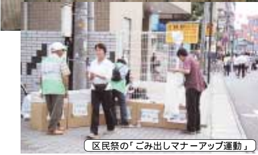
区民祭の「ごみ出しマナーアップ運動」

拾えば、そのときはきれいになるが、継続してまちをきれいにするためには、区民一人一人の心がけが大事」と美化活動の難しさも語ってくれました。きれいなまちをめざして、川崎市美化運動実施高津支部の活動は今日も続きます。