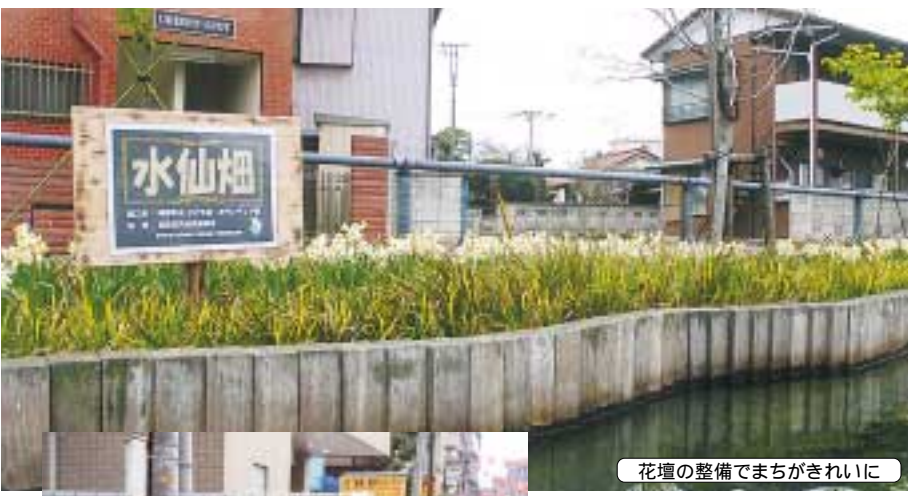
花壇の整備でまちがきれいに

い。そして、何よりまちがきれいになることの喜びと充実感が支えとなり、大変な美化活動も続けられる」とメンバーは語ります。「ごみを