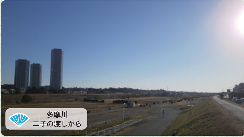
多摩川 二子の渡しから