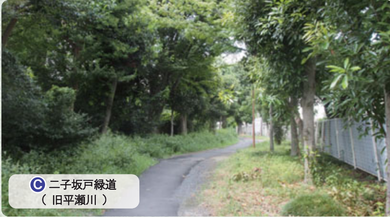
二子坂戸緑道 (旧平瀬川)