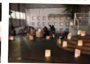
灯ろうの傍らで夜カフェ