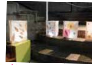
手作りの灯ろうを中庭に

子ども達が作った灯ろうや、本格的な大灯ろうは、大山街道を歩く人の注目の的でした。