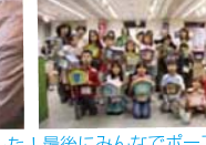
“昔遊び”では子ども以上に大人がはしゃいでいました