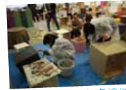
会場のボックスに色塗り

会場内のボックスは、明治大の学生と地元企業のコラボレーション。会場を彩りました。