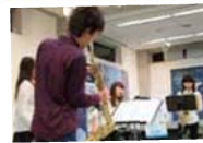
オープニングで地元の音楽家・音大生のライブ!