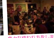
色々な使われ方をしました

子ども達が作った灯ろうや、本格的な大灯ろうは、大山街道を歩く人の注目の的でした。