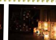
大灯ろうは目を引く迫力!

高津の子ども達も、大山街道で学び・作り・遊ぶ色々な子どもイベントに、大勢参加しました。