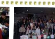
“で大山街道沿いの地域と交流!”

「大山みちまちウィーク」には、今までアクションフォーラムでお会いすることのなかった高津区の方々にも大勢お越しいただけたほか、大山街道沿いの二子玉川、用賀、伊勢原などの地域からも多数ご参加いただき、地域を越えた交流を持つことができました。今回のイベントで集まった仲間が地域とのつながりを深め、より一層の盛り上がりを生み出すようアクションを起こしていきましょう!