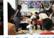
ではダンボールや竹を使った色々な灯ろうを作りました!