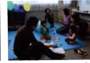
“子育てほっとサロン”