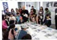
“大山街道ドキドキツアー”でお宝探しの旅へ!!

高津の子ども達も、大山街道で学び・作り・遊ぶ色々な子どもイベントに、大勢参加しました。