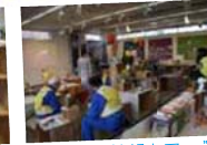
“みちまち情報カフェ”