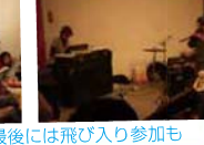
ムードな“ジャズバー”

カフェやバーで、おいしく楽しいひと時を演出。野菜・名産品・お土産も大人気でした。