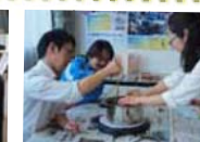
“ミツロウキャンドル作り”