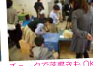
チョークで落書きもOK!