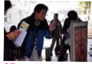
QRコードで街の情報ゲット!“コピキタスマち歩き”