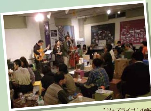
“ジャズライブ”の様子

大山街道アクションフォーラムの中でも話し合われてきた、「まちの拠点づくり」「みんなが集まれる場所づくり」「これまでの様々な取組みの結びつけ」「これまで関わっていなかった方々との交流のきっかけづくり」「まちづくりの人材発掘」などを実現することを目的として行い、写真のような成果が出ました。