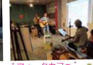
“ジャズライブ”はプロ級の演奏で大盛り上がり! 最後には飛び入り参加も