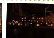
目を追うごとに増えました