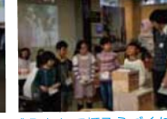
“みんなで大灯ろうづくり!”