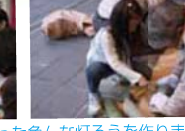
最後にみんなでポーズ!