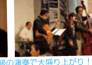
“ベジカフェ”でほっこり休憩