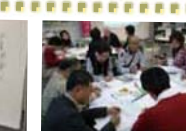
“トーク&フォーラム”