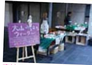
高津区の野菜や名産品、伊勢原のお土産などを販売!

カフェやバーで、おいしく楽しいひと時を演出。野菜・名産品・お土産も大人気でした。