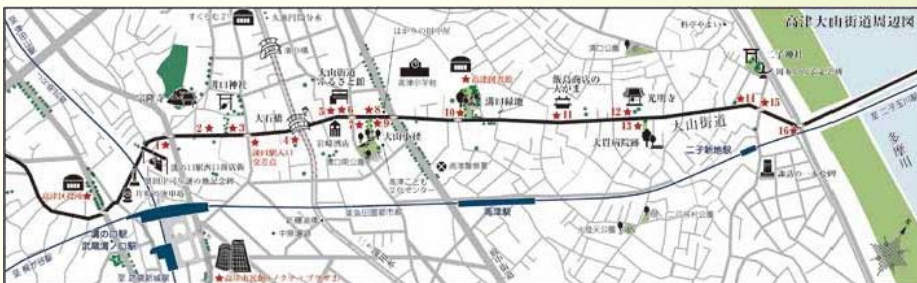
★にQRコードステッカーが設置されています。数字の付いている★では、付近の歴史資源に関するクイズにも答えることができます。