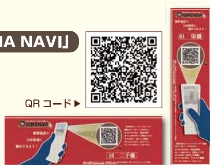
街路灯や案内板に赤いステッカーを設置

大山街道沿いの街路灯などに貼られたQRコードを、携帯電話に付属のバーコードリーダー機能で読み取ることで、大山街道の歴史情報や歴史クイズ、クチコミ機能などを利用することができる携帯電話向けの情報発信サイトです。