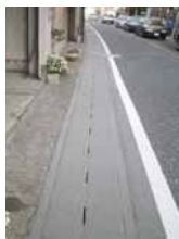
宗隆寺周辺の景観舗装整備後の様子

昨年度は、高津図書館や大山街道ふるさと館、岩崎酒店の前などのキラリスポットで景観舗装整備が行われました。今年度は新たに、溝口神社と宗隆寺の前の整備を行いました。今後は光明寺・大貫家(二子2丁目)付近の整備を行う予定です。