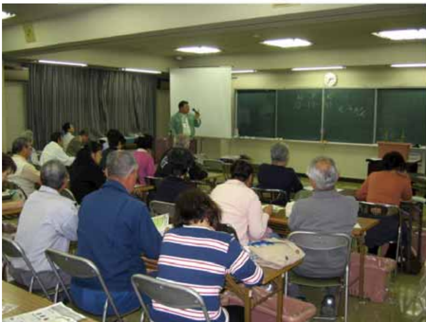
緑のカーテン講習会(4月に区内で2回実施)