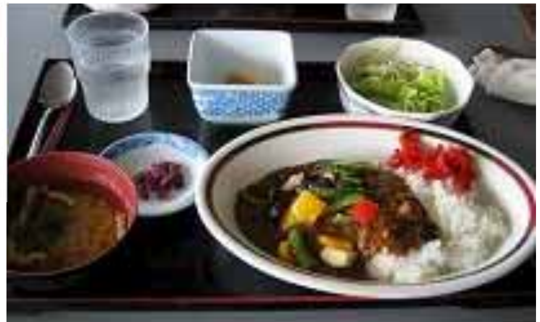
「レストランたかつ」でゴーヤーメニューの提供(8月)