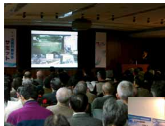
「全国円筒分水サ ミット2011inたか つ」を開催