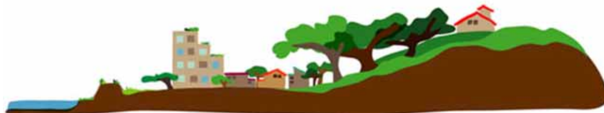
地形の立体イメージ図