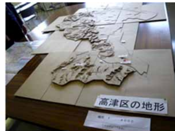
高津区立体地形模型