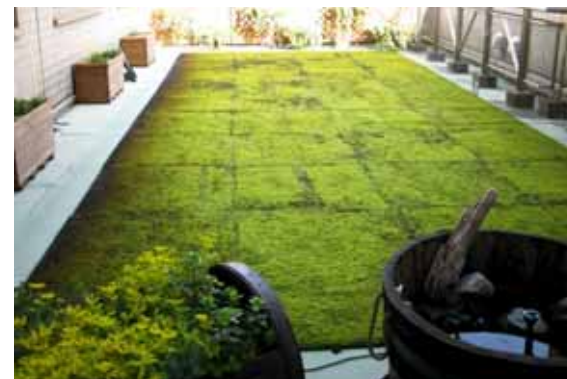
コケによる屋上緑化