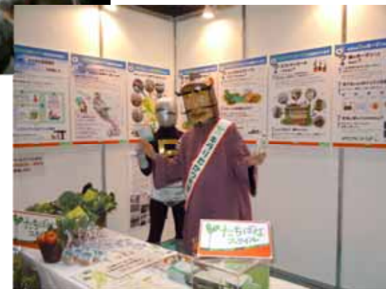
「川崎国際環境技術展2011」に出展