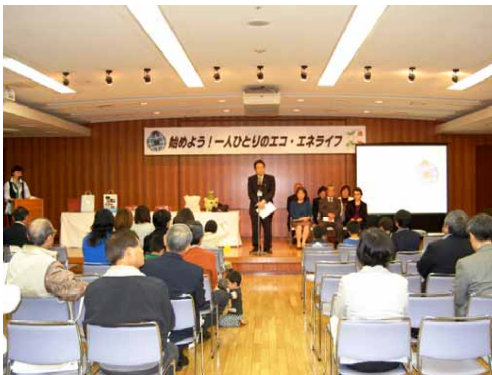
エコ・エネライフコンクール表彰式