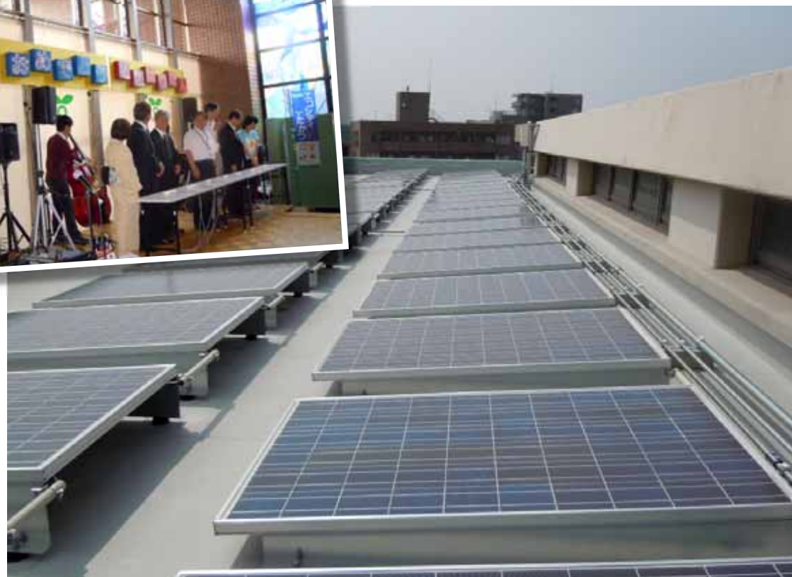
蓄電池一体型太陽光発電システムを設置