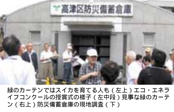
緑のカーテンではスイカを育てる人も(左上)エコ・エネライフコンクール授賞式の様子(左中段)見事な緑のカーテン(右上)防災備蓄倉庫の現地調査(下)

第二期では「環境まちづくり」「地域防災とコミュニティー」をテーマに調査審議を進め、課題解決に向けた具体策を検討しました。「エコ・エネライフコンクール」の開催や、災害用備蓄倉庫の現地調査などづくりに実行可能なものは、区民会議が主体となりながら