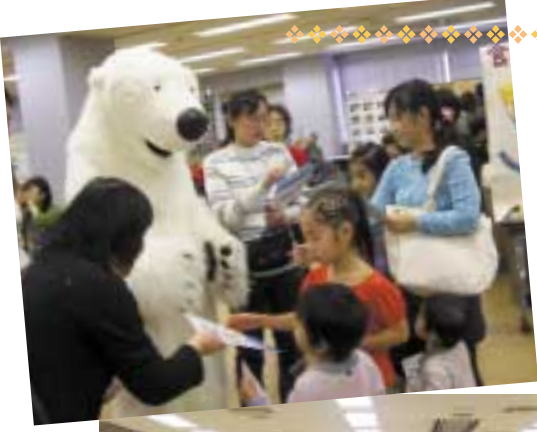
白クマも来て見本市を盛り上げました。(写真上) 昨年の特別講演の風景(写真下)

来年1月には、日本で初めて「円筒分水サミット」を高津の地で開催する予定です。今後とも地域の特性を生かした、魅力ある区づくりを進めてまいりますので、ご支援・ご協力をお願いいたします。