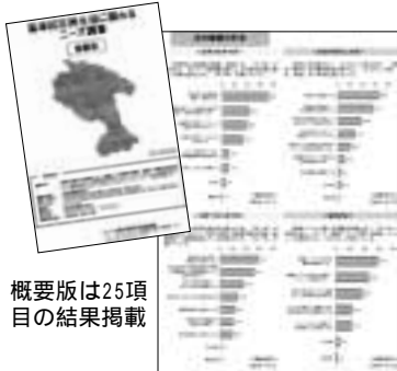
概要版は25項目の結果掲載

所二階企画課窓口で配布しています。区ホームページからもご覧になれます。 申込 区役所企画課 ☎(861)3131、FAX(861)3103