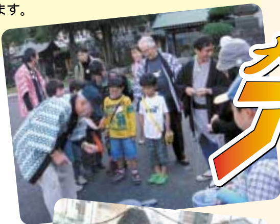
なぞときドキドキツアー

子どもたちに大山街道を「ふるさと」として愛着をもってもらうため、地域の子もたちを中心に「大山みちまち探検隊」を結成し、「大山街道なぞときドキドキツアー」を行いました。子どもたちとまちを探検したり蔵の中に入ったり、昔遊びを楽しんだりしました。このなぞときドキドキツアーをもとに「大山みちまちマップ」を作成しました。地域振興課窓口で配布しています。