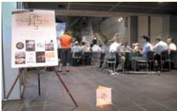
お茶を飲みながら気軽におしゃべりができます