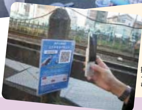
携帯電話でコードを読み込むだけ

区では、21年度に策定された「高津大山街道マスタープラン」を推進するため、大山街道とその周辺を活性化させる取り組みを進めています。これまでに行った主な取り組みを紹介するとともに、一緒に活動する人を募集します。