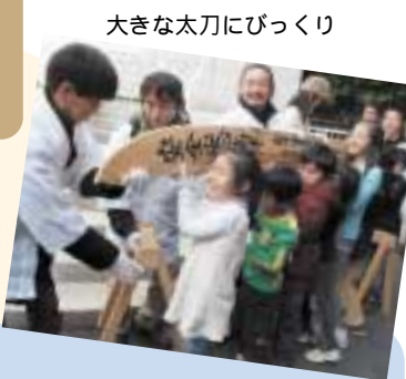
大きな太刀にびっくり

マスタープランで定めた重点地域であるキラリスポット(二ヶ領用水から高津交差点、溝口緑地付近)の歩行空間の整備を行いました。側溝のふたの改修と景観に配慮したカラー舗装を行い、以前よりも安全に歩ける歩行空間になりました。