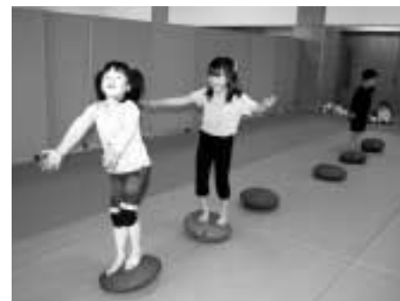
楽しく運動ができます

毎月曜(第4月曜日、祝日を除く)午後4時半～5時20分。3歳～小学2年生。30人。1回500円。高津スポーツセンター。当日先着順に受け付け。 問同センター ☎813-6531、FAX 813-6532