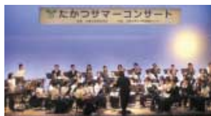
去年のコンサートの様子

曲目 龍馬伝(オープニングテーマ)、情熱大陸、交響的序曲ほか ☎6月30日(必着)までに希望者全員(2人まで)の氏名、代表者の住所、電話番号を記入し往復ハガキで〒213-8570高津区役所地域振興課「たかつサマー・コンサート」