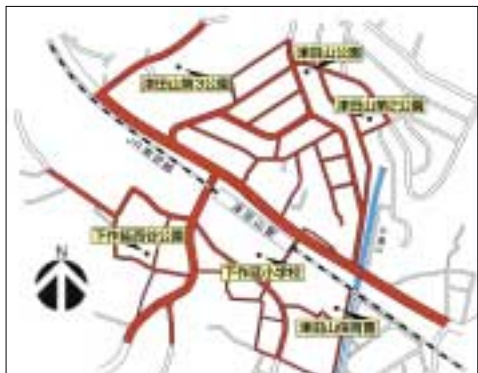
色のついた道路が駐車禁止区域です

日時 11月13日(土)午前10時半～午後3時 場所・区画高津市民館 ☎814-7603、FAX 833-8175