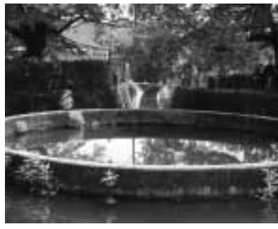
二ヶ領用水久地円筒分水

区まちづくり協議会では、二ヶ領用水竣工四百年、久地円筒分水七十周年にちなんで二ヶ領宿河原堰から円筒分水までを歩き、用水の歴史を学ぶイベントを開催します。