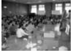
子どもも大人も楽しめる企画が満載

藤工芸や拡大写本、水筆・血压測定、体組成測定など申し込み不要・無料の体験コーナー、リサイクル本コーナーなど。健康体操や太極拳など参加自由のコーナー、子どもゲームコーナーも盛りだくさんです。1日限定の催しもありますので、詳しくはお問い合わせください。