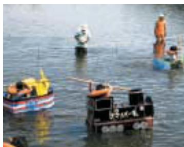
段ボールで作った「どろ船」が多摩川を走り抜けます

日時 8月24日(金)～29日(水) 午前10時～午後7時 場所 高津市民館ギャラリー