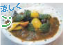
ゴーヤーと夏野菜のカレー

区役所の「緑のカーテン」から収穫したゴーヤーが、ことしもランチになりました。新メニューが期間限定・数量限定で登場します。