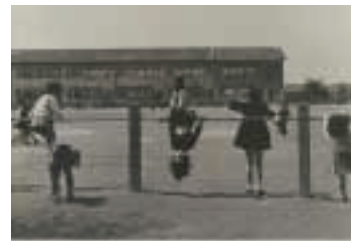
元気がいいに遊ぶ姿は今昔も変わりません

区子ども会連合会はことしで60周年を迎え、各地区にある子ども会活動の中心的な役割を担っ