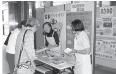
バランスの良い食事の紹介も

食育キャンペーンやイベントでの食育推進、各種料理教室の開催など、地域で食生活を通して健康づくりのための活動をしています。