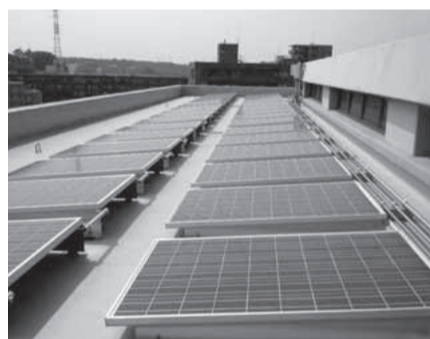
区役所屋上の太陽光発電パネル

環境に配慮した取り組みをツアーで紹介しています。詳細はお問い合わせください。囲区役所企画課☎861-3132、FAX861-3103。