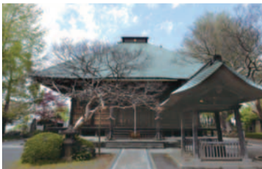
木立に囲まれ静かにたたずむ影向寺

天平12年(740年)に聖武天皇の命を受けた行基によって開かれたと伝えられています。平安時代に作られた薬師如来像はケヤキの一本造りで国の重要文化財に指定されています。