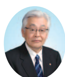
土方愼也 高津区長

このたび、高津区長に就任しました土方愼也です。高津区は多摩川や二ヶ領用水の水辺、丘陵地の緑などの豊かな自然があり、大山街道や円筒分水、橘樹郡衙跡などの歴史的・文化的資源にも恵まれたまちです。