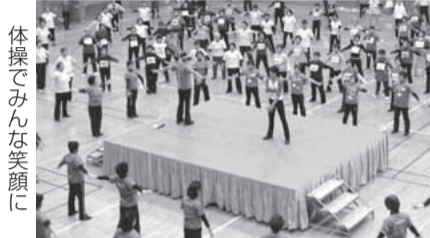
体操でみんな笑顔に

体操講座や介護予防講座など、日常生活に運動を取り入れ、健康づくりに役立つための活動をしています。