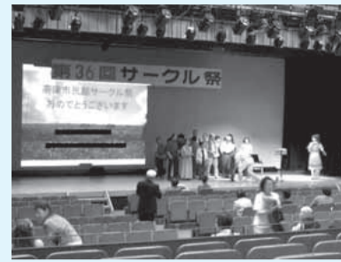
市民活動の内容を知るチャンス

日時 6月7日(土)、8日(日)10時～16時 場所 高津市民館 囲高津市民館☎814-7603、FAX833-8175