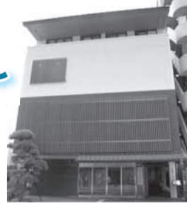
東海道かわさき宿交流館

囲5月15日9時から直接、高津区老人福祉・交流センター☎853-1722、FAX853-1729。[先着順]