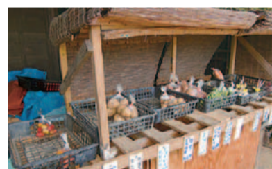
新鮮野菜が並ぶ直売所