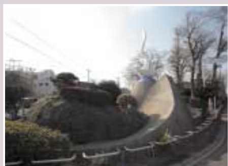
場所 二子1-4-1 (二子神社内)

かの子を顕彰する文学碑。太郎はこの作品について「巨大な白い姿が夢のように碧空に浮びあがる奇跡のような印象。その姿はかの子のいのち、といたい」と説明しています。ぜひ晴れた日に鑑賞してください。