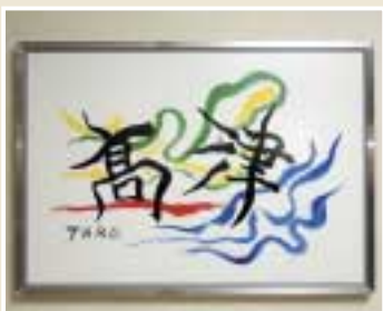
場所 高津市民館11階