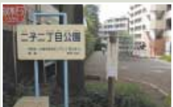
場所 二子2-8 (二子二丁目公園)