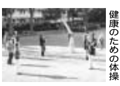
健康のための体操

歯周病予防教室 歯科健診、相談・唾液の潜血テスト、ブラッシング実習など。8月2日(火)13時半～15時(受け付け13時～13時半)。保健福祉センター。15人。囲園7月15日から電話で区役所地域保健福祉課☎861-3313、FAX861-3307。[先着順] 高津公園体操講演会 高津公園体操は寝たきりになる大きな原因の「生活習慣病」「転倒・骨折」の予防となる体操。8月5日(金)9時半～11時半(受け付け9時15分～)。区役所第1会議室。50人。講師：藤原佳典(医師)ほか。囲園7月15日から電話で地域保健福祉課☎861-3313、FAX861-3307。[先着順] 市民自主企画事業「高津の緑地活動学習会・見学会」 区に残る緑地を保全するために、緑地の変遷やターザンの木など区内の里山を訪ねる。学習会...8月26日(金)18時半～20時半。見学会...9月4日(日)9時半～12時の全2回。高津市民館。40人。囲園8月2日から電話かFAXで高津市民館☎814-7603、FAX833-8175。[先着順] 骨粗しょう症予防事業「きれいは内側からめざせ骨美人」 骨密度測定、運動実技、食事と運動に関する講話。8月31日(水)