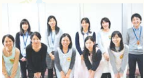
私たちがサポートします!

「困っていることがあるので支援してもらいたい」「地域とつながりたい」「人や地域の役に立ちたい」そんなことを思ったら、ぜひ地区担当保健師にご相談ください。私たちがサポートします!