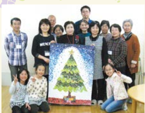
メイフェアカフェでクリスマスツリーのちぎり絵を作りました!

試行開催を経て、現在は毎月1回開催しています。大勢の人に参加してもらいたくて、ヨガ体操やちぎり絵などの催し物を各回企画しています。その他にも麻雀や囲碁、お茶やおしゃべりを楽しんでいます。