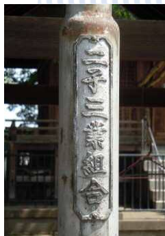
今も残る「二子三業組合」の街灯柱。

黒い板塀が印象的な料亭やよい。二子新地の「新地」とは、新開地にできた遊里を指す言葉。その地名のとおり、大正14年に二子橋が開通してから昭和40年頃まで、二子新地は花柳界として栄えました。最盛期の二子新地では100人近くもの芸者が働いていたそうです。