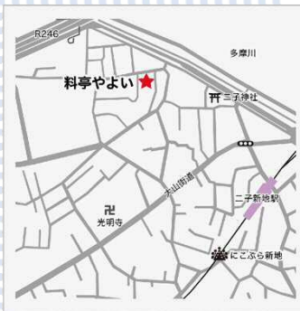
東急二子新地駅 徒歩5分