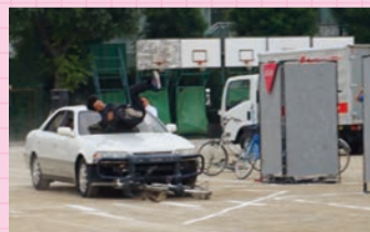
交通事故の危険性を学びます