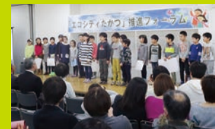
子どもたちが生き物や環境について学んだことを発表します