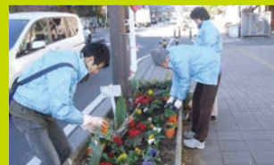
まちの花壇をお花でいっぱいにします