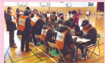
大地震に備えてみんなで訓練