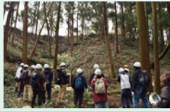
「森の再生」モデル地区見学の様子

応募資格 一年以上区内に在住・在勤・在学しているか区内での活動経験1年以上の満18才以上(7月1日現在)の人。＊市職員と市の附属機関などの委員は除く