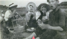
担当お気に入りの1枚