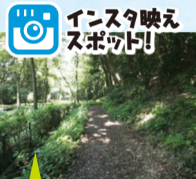
インスタ映えスポット!