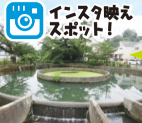
インスタ映えスポット!