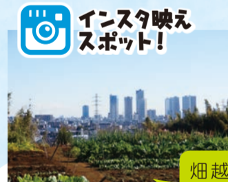
インスタ映えスポット!

子母口住宅前バス停→子母口貝塚→蓮乗院→たちばな古代の丘緑地→橘出張所(3.4km)