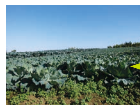
インスタ映えスポット!