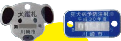
犬の鑑札 & 注射済票

ネズミ、ハチ、ゴキブリなどの衛生害虫などに関する相談では、駆除方法の説明や駆除業者の紹介をしています。ご自身で駆除をする場合は、駆除用器具やハチ用防護服(アシナガバチ用)を無料で貸し出します。