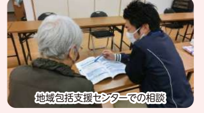
地域包括支援センターでの相談