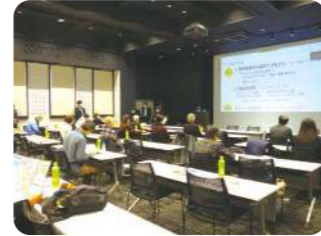
マンション未来学習館見学会&交流会