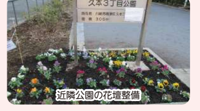
近隣公園の花壇整備