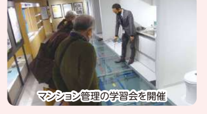
マンション管理の学習会を開催