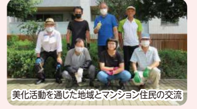
美化活動を通じた地域とマンション住民の交流