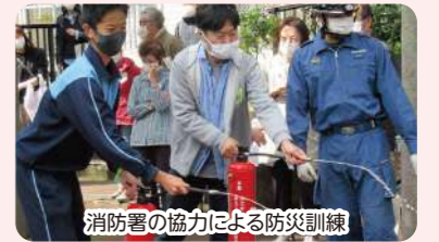
消防署の協力による防災訓練

川崎市まちづくり公社ハウジングサロン 管理組合の運営・管理規約・修繕積立金・長期修繕計画・大規模修繕工事・耐震等に関する相談をお受けします。 Tel. 044-822-9380 Fax. 044-819-4320 ※予約受付 毎週火～土曜日(火～金の祝日及び年末年始は休み) 9時～12時・13時～16時 Webサイト