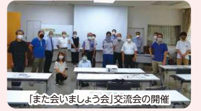
「また会いましょう会」交流会の開催