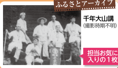
ふるさとアーカイブ