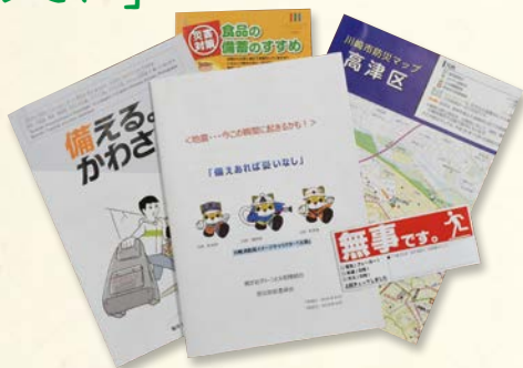
入居者に配布しているマニュアルなど

同マンション敷地内で紙の燃えかすが発見されたことが契機となり、住民の防犯意識が高まりました。防犯カメラの設置や「防災・防犯委員会」設立の取り組みを進め、防災に関する「梶ヶ谷グリーンヒル災害対策本部」を組織化。入居者全員に活動班への参加を呼びかけました。防災マニュアルや安否確認シールと不在連絡届の作成を行い、全戸に配布しました。