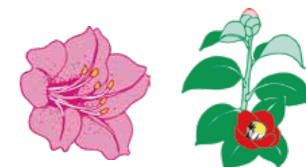
市の花 つつじ 市の木 つばき