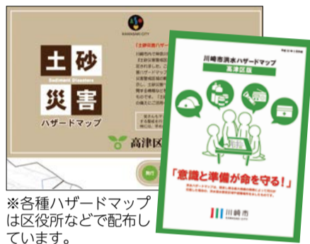
※各種ハザードマップは区役所などで配布しています。

区役所では各種ハザードマップ(土砂災害、洪水)を配布しています。自分が住んでいる地域にどんな危険があるのか把握しましょう。家族構成によっても適切な避難行動が異なります。自分や家族が避難する必要があるかどうか事前に確認しておきましょう。