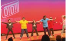
ダンスダンスたかつ (R2.1)