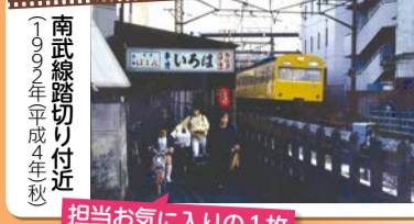
担当お気に入りの1枚