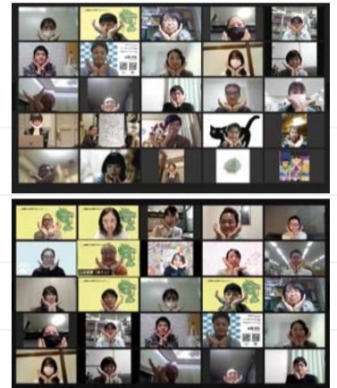
ワークショップはオンラインで実施。次世代を担う若い人の意見を引き出すため、区出身のかわさき若者会議のメンバーが進行役を務めました

公募で集まった区民と一緒にワークショップを開催し、記念ロゴマークやPR動画の素材の一つとして、高津区の地域資源や魅力を出し合ってもらいました。その一部を紹介します。