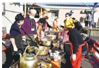
被災地での活動の様子

「たかつボランティア・当事者連絡会」は、区内でボランティア・当事者活動に取り組む38のグループと個人が、情報交換や親睦を図り、福祉活動への取り組みを推進することを目的に発足しました。「健康福祉まつり」や「てくのまつり」などのイベントへの参加や、被災地での活動、スプリングウォーキングの開催などの活動をしています。 申込 高津区社会福祉協議会 ☎044-812-5500 FAX044-812-3549(8時半～17時、月～金曜。祝日、年末年始を除く)