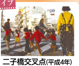
二子橋交叉点(平成4年)