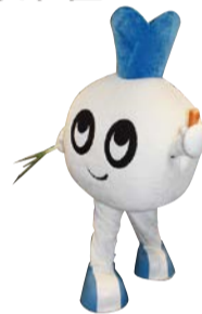
川崎フロンターレ マスコット カブレラ

「環境配慮型ライフスタイルへの行動変容」を進めるため、広報・啓発を連携して実施します。