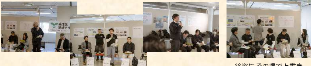
絵姿にその場で上書き