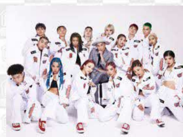
#2 KADOKAWA DREAMS