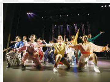
#1 洗足学園音楽大学ダンスコース