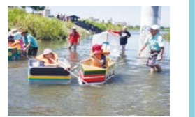
高津区子どもフェアのどろ舟レース

高津区子ども会連合会は高津地区、橘地区の合計24の子ども会で構成されており、会員数は約2,000人です。多くの子どもたちに子ども会の楽しさを知ってもらい、参加してもらうため、今までの行事・イベントに加え、時代に即したイベントも企画しています。高津区子ども連合会は、これからも「子どもたちの手による、子どもたちのための子ども会」を理念として、地域・家庭・学校での子どもたちの成長を見守る活動を行っていきます。