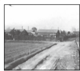
昔の千年新町付近の江川