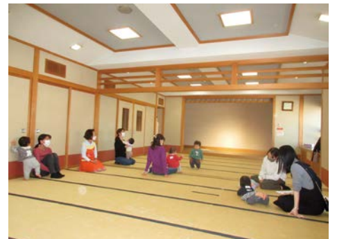
乳幼児向け子育てサロン「なかよしルーム」の様子

高津区内には町内会や自治会から推薦された民生委員児童委員が193名います。主に生活の中での困りごとなどの相談窓口として活動しています。高齢者の介護や子育ての悩みなどを相談することができます。また、高齢者や乳幼児向けのサロンの実施にも取り組んでいます。詳細はお住まいの地区の民生委員児童委員にお問い合わせください。