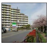
現在の千年新町付近の江川