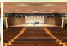
700人収容可能なホール