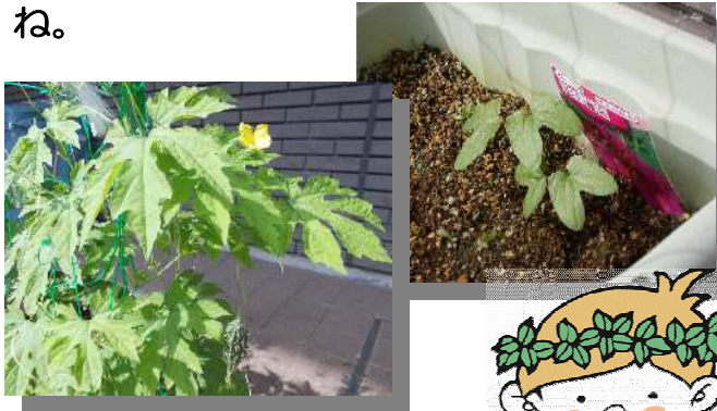
かわさき緑のイメージキャラクター 緑の妖精 グリンピー

図書館の閲覧席側の窓辺でゴーヤを栽培中です。黄色のかわいらしいお花が見られます。ご来館の際に探してくださいね。