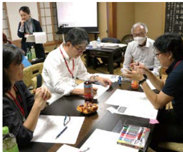
まちづくり活動の仲間探しや企画支援を行う「まちづくりカフェたかつ」