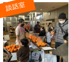
柑橘系皮むき体験