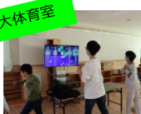
eスポーツ 画面を見ながらとにかく体を動かそう！