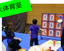
ディスクゲッター ディスクを的に当てられるかな？