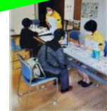
みんなで健活、 健康チェック測定会