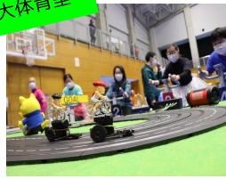
2種類の自転車競技体験

*ワットマンバイク… 2人対戦型のタイムトライアル *チャリタマ… 自転車を漕ぐとオモチャが動き速さを競います。