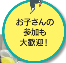
お子さんの 参加も 大歓迎！