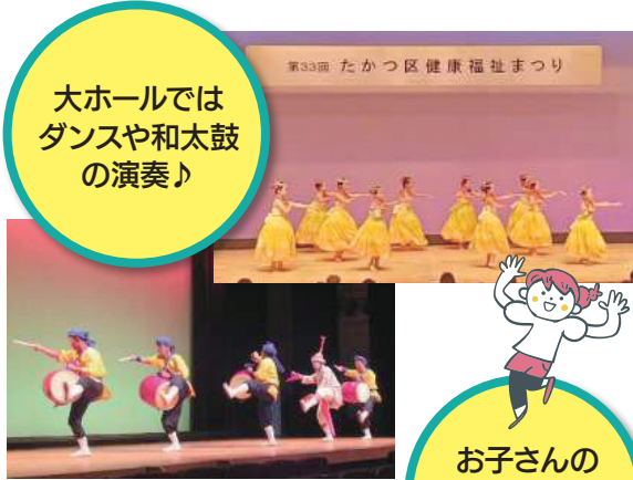
大ホールでは ダンスや和太鼓 の演奏♪