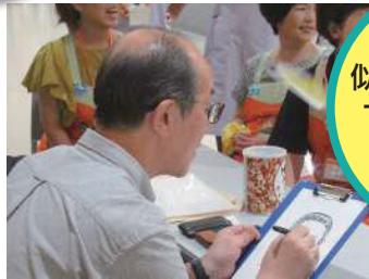
似顔絵コーナーも！ できあがるまで ドキドキ…！