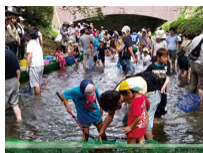
緑豊かな二ヶ領用水での魚つかみ

身近な公園などで、お父さんやお母さんたちも、お子さんがのびのび・のんびり遊べる遊び場を開いてみませんか？ 開き方がわからないときは外遊び交流委員会がお手伝いします。