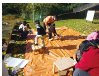
人気の木工コーナー