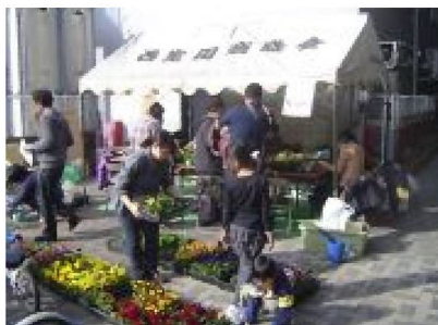
フラワーバスケットワークショップ

都市計画マスタープラン多摩区構想検討委員会で川崎市長に提言した事を市民レベルでも出来るところから実現してみようと、2006年に結成されたまちづくりボランティアグループです。誰もが気軽に参加できる楽しい企画やイベントを通じて同じ生活圏に暮らす人々のネットワークを構築する事(ソフト面の活動)と、活動を通じて日頃からまちの将来を考えたり、問題意識や課題を持ち寄ったりするような「まちについて考える環境や場」をつくる事(ハード面の活動)を2つの活動の軸としています。