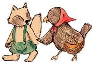
公式キャラクター(タヌ吉・カー子)