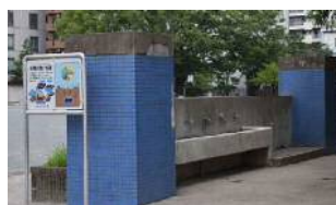
既設水栓型・併設型（開設不要）