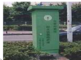
給水装置格納庫（開設型）