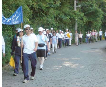
委員が先導し安全確保

日 時：平成26年6月15日(日) コース：生田出張所～農業技術支援センター ～小沢城址～薬師堂～稲田公園 参加者：33名 委 員：20名（稲田地区）