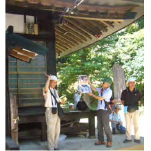
観光ボランティアガイド による解説