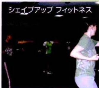
シェイプアップ フィットネス

元気・勇気・笑顔を合言葉に自分らしさを表現しながらポンポンを持って曲に合わせて楽しく踊ってみましょう。