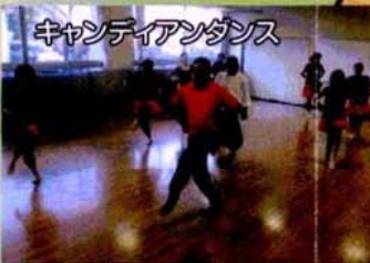
キャンディアンダンス

スリランカからやってきた本物のスピリチュアルダンス。踊りながら日頃のストレスを体外に、ダイエット効果も期待できます。