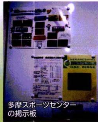
多摩スポーツセンターの掲示板