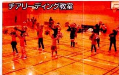
チアリーディング教室