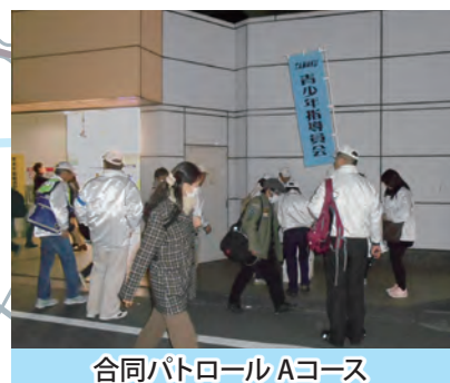
合同パトロール Aコース