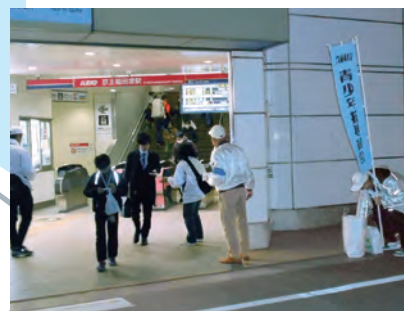
合同パトロール Cコース