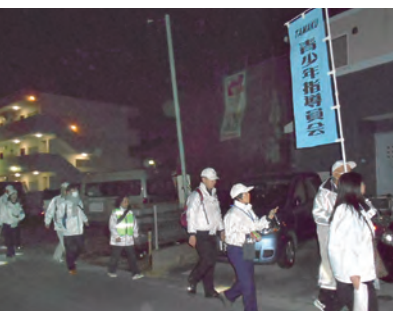
合同パトロール Bコース

私たち多摩区青少年指導員は、通常所属地区ごとに分かれてパトロールを実施しています。この度、所属地区以外の地区パトロールを試みることとなり、菅地区にて3コースに分かれ、総勢35名で合同パトロール及び啓発活動を実施しました。