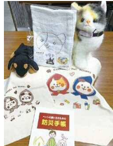
動物のイラストを使ったグッズ