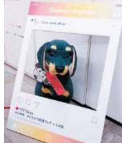
インスタグラム風のフォトフレーム