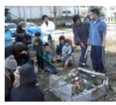
普段とは違う遊びに興味津々

「思いっきり外遊び」 区では、子どもを対象とした外遊び事業を行います。 定員 当日先着八百人 区役所地域振興課 ☎(935)3135、FAX(935)3391