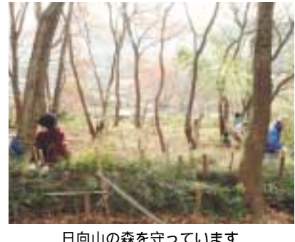
日向山の森を守っています

月に一回、竹の伐採、ササ刈り、植樹などの活動を行います。みなさんも活動に参加してみませんか。帽子・手袋を用意し、動きやすい服装で当日直接、日向山山頂広場までお越しください。 四月の活動日時 四月十八日(日)午前九時半～正午ごろ(小雨決行)。雨天時は四月二十五日(日)