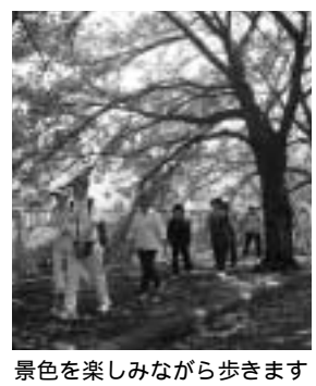
景色を楽しみながら歩きます

区では、健康づくりと介護予防を目的に「多摩区健康ウォーク体験教室」を開催しています。今回は、区の歴史を感じられる全行程三・五キロの小沢城址コースです。 日時 五月十一日(火)午前九時半(JR稲田堤駅集合) 正午ごろ(同駅解散) 雨天時は五月十三日(木)に延期