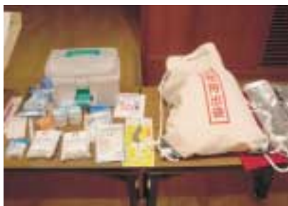
いざというときに必要な防災グッズを展示

・災害写真など防災パネルの展示 ・防災用品の配布(当日先着五百人には非常食などの配布を行います) 防災講演会 時間 午後一時半～三時 (開場一時) 場所 多摩市民館大ホール