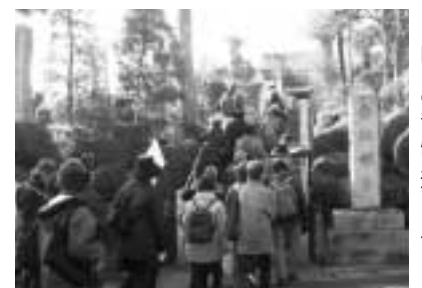
区内の名所を巡ります

け。12時ごろ向ヶ丘遊園駅解散。40人。保険料など50円。飲み物、タオル、雨具持参。囲1月16日から直接か電話で区役所地域保健福祉課 ☎935-3294。[先着順]