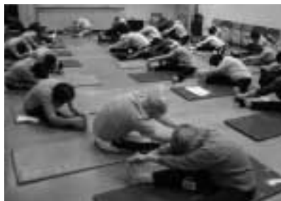
体を動かして気持ちよく

区運動普及推進員と一緒に心も体もほぐれるヨガを体験してみませんか。動きやすい服装でご参加ください。1月23日(月)13時半～15時(13時15分から受け付け)。同センター1階講堂。当日先着30人。タオル、飲み物持参。