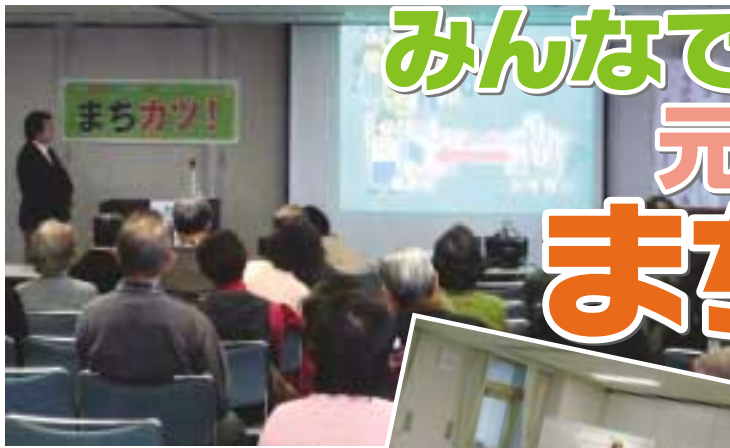
区内の活動団体の情報が掲示されます