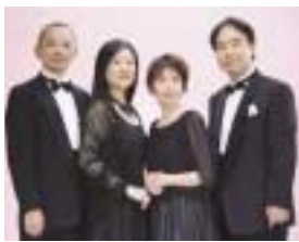
ア・カペラグループ アリアス

日時 一月十八日(水)正午～午後零時三十分 場所 区役所一階アトリウム 出演 ア・カペラグループ アリアス 曲目 見上げてごらん夜の星を