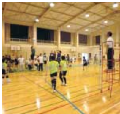
力を合わせてプレーします