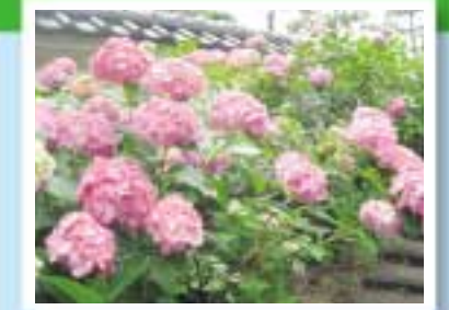
写真NEWS・妙楽寺のアジサイ

通称「あじさい寺」。境内の約1,000株の色とりどりのアジサイが見頃を迎えます。6月16日(日)には、境内であじさい祭りが開催されます。