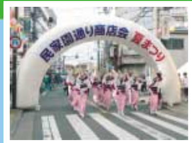
写真NEWS ● 民家園通り商店会夏まつり

老若男女が楽しめるお祭りです。様々な催しがあります。こ とは、7月20日(土)に開催します。