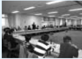
熱い議論が繰り広げられます

第1回は、「生田緑地マネジメント会議」についてです。この会議は、3月に設立され、市民団体、町内会・自治会、商店街、大学、行政など49団体が参加しています。生田緑地の豊かな自然を守り、誰もが楽しめる場となるように、魅力をもっと知ってもらえるように、さまざまな取り組みを進めていきます。