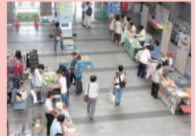
心を込めて作られた作品が並びます

場所 区役所1階アトリウム ☎区役所地域保健福祉課 ☎935-3267、FAX935-3276