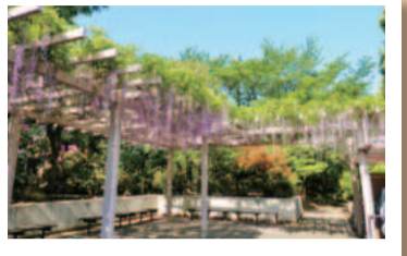
写真NEWS・緑化センターのフジ

敷地内には日本庭園があり、季節ごとに美しい花が咲き誇ります。例年、4月はフジが見頃を迎えます。