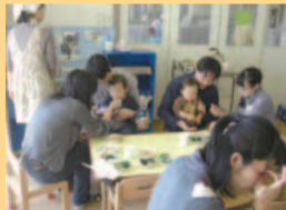
親子で楽しくランチの様子