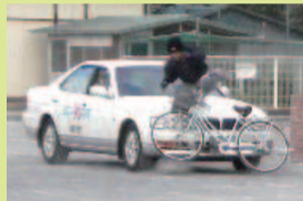
事故の怖さが体験できます