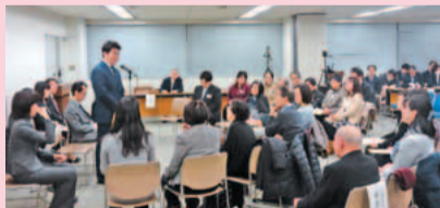
川崎区役所での車座集会(2月21日)

申し込み方法[抽選] 4月17日17時までに区役所で配布する申込書に記入しサンキューコールにファクスするか市ホームページで。※区役所企画課へ直接持参も可。当選者にファクスかメールかハガキで通知します。☎サンキューコールかわさき ☎200-3939、FAX200-3900。区役所企画課 ☎935-3147、FAX935-3391。