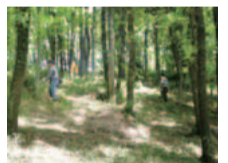
里山の保全に努めます

日時・集合場所 4月20日(日)9時半～昼ごろ、雨天時は27日(日)。日向山の森(東生田緑地)頂上広場 ☎日向山うるわし会事務局(石郷岡) ☎944-1941。区役所地域振興課 ☎935-3131、FAX935-3391