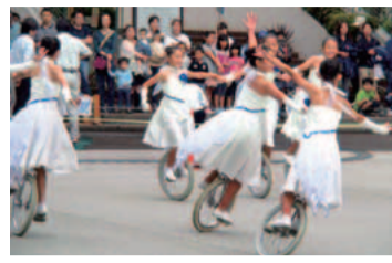
写真NEWS・中野島音楽祭

多摩区統計データ (平成26年6月1日現在) 人口 21万4,173人 世帯数 10万5,340世帯