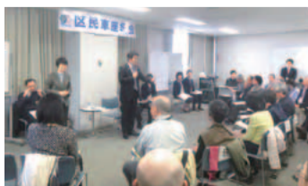
前回の多摩区役所での車座集会(4月25日)

圃サンキューコールかわさき ☎200-3939、FAX200-3900。〒214-8570多摩区役所企画課 ☎935-3147、FAX935-3391