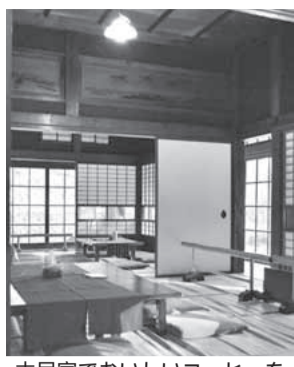
古民家でおいしいコーヒーを