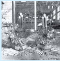
手作りの門松で正月を迎えませんか

生田緑地の管理で発生した竹や松を使って、自分だけの「ふくふくミニ門松」を作ります。事前申込制です。※雨天時は屋内で行います 日時 12月20日(土)10時～12時、13時～15時 場所 生田緑地中央広場 費用 2,000円 囲田12月15日までに電話で生田緑地東口ビジターセンター☎933-2300 囲生田緑地整備事務所☎934-8577、FAX934-8578