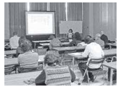
新しい発見をしてみませんか

囲各開催日の1週間前(必着)までに、往復ハガキかFAXに参加者の氏名、住所、電話番号、FAX番号(FAXで申し込む場合)、参加人数、希望する回を記入し〒211-0052中原区等々力1-2市民ミュージアム「学芸員研究ノート」係☎754-4500、FAX754-4533。[抽選]。ホームページ(☎http://www.kawasaki-museum.jp/)からも申し込みます。