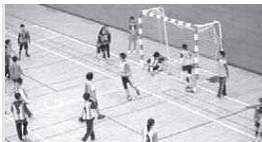
みんなが楽しくハンドボール

1月10日(土)、11日(日)、9時半～11時半、全2回。同センター大体育室で。両日参加できる小学3～6年生、10人。参加費1,000円。囲12月15日9時から電話で。[先着順]