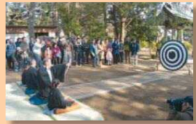
長尾神社の「射的祭」

围園12月17日から直接か電話で区役所地域保健福祉課 ☎935-3117、☎935-3276。[先着順]