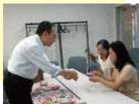
ふれあいシミュレーションの様子