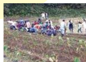
「食育の秋 in よみうりランド」の様子