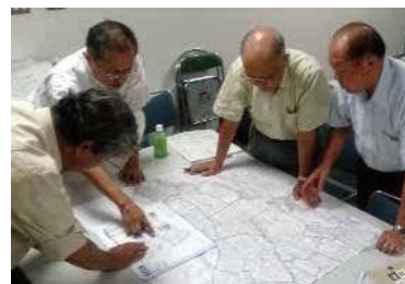
防災マップ下地づくりの様子